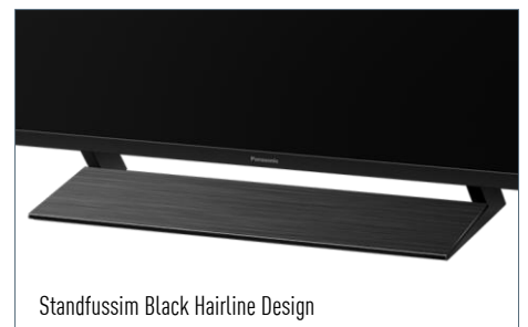
Standfussim Black Hairline Design